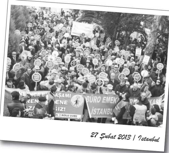
27 Şubat 2013 | İstanbul

Maliye önünde gerçekleştirilen iş bırakma eyleminin ardından, İskele Meydanı'nda bir basın