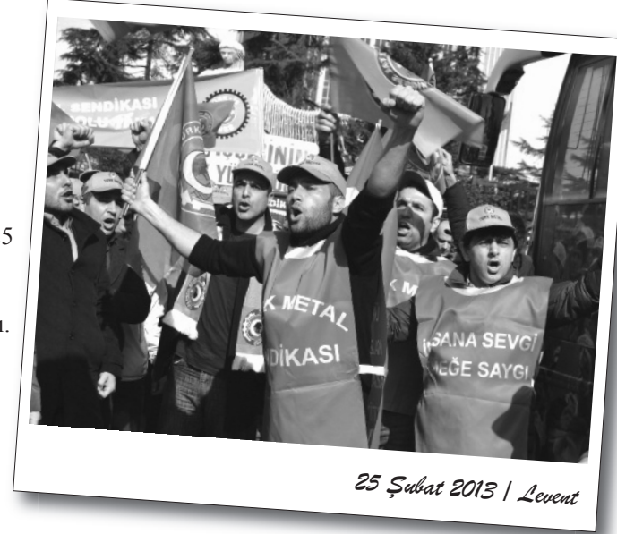
25 Şubat 2013 | Levent

Bağımsız Devrimci Sınıf Platformu'nun "Sendika düşmanlığına, korsan sendikaya geçit vermeyeceğiz! DHL'de direniş kazanacak!" pankartıyla yer aldığı yürüyüş boyunca "Korsan sendika istemiyoruz!", "İşbirlikçi sendika