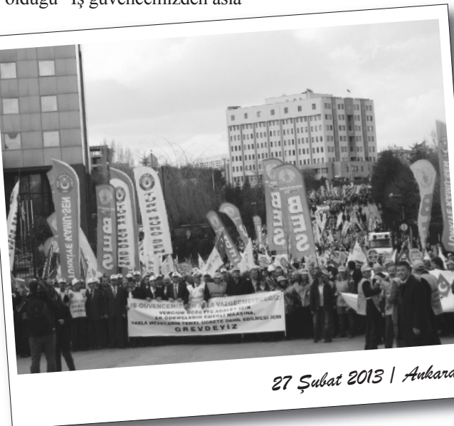
27 Şubat 2013 | Ankara

Kızıl Bayrak / İstanbul-Ankara-Bursa-Çanakkale-Adana-Kayseri